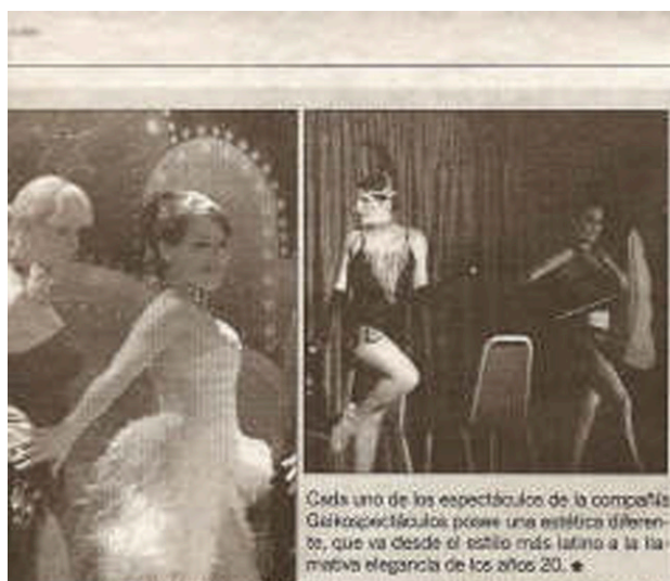
Cada uno de los espectáculos de la compañía Gekkopectáculos posee una estética diferente, que va desde el estilo más latino a la llamativa elegancia de los años 20. *